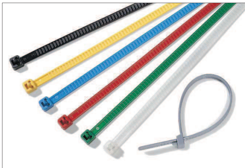
Opaski rozpinalne LR55 nadają się idealnie do kolorowych oznaczeń.

Opaski rozpinalne przeznaczone są do wielokrotnego użytku przy montażu czasowym lub gdy wymagane jest częste zakładanie i zdejmowanie opasek.